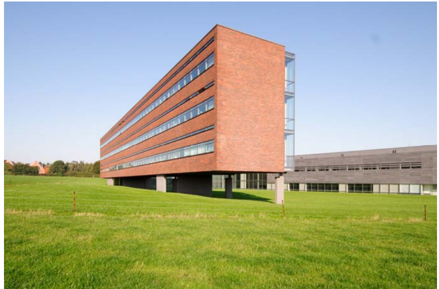
B&O: Klimatilpasning og lavenergidesign i helhedsperspektiv.

Samtidig kan glasandelen mod syd, og derved kølebehovet, mindses ved at minimere rumdybden. Det 'lyse' kontor har derfor en zonedelt planløsning med mindre servicefunktioner mod syd og større kontorarealer mod nord.